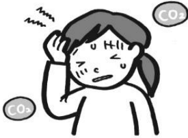
二酸化炭素が増え、 頭が痛くなる