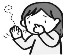
いやなおいが部屋に こもる