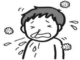
チリやホコリが アレルギーの原因になる