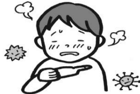
インフルエンザなどに 感染しやすくなる